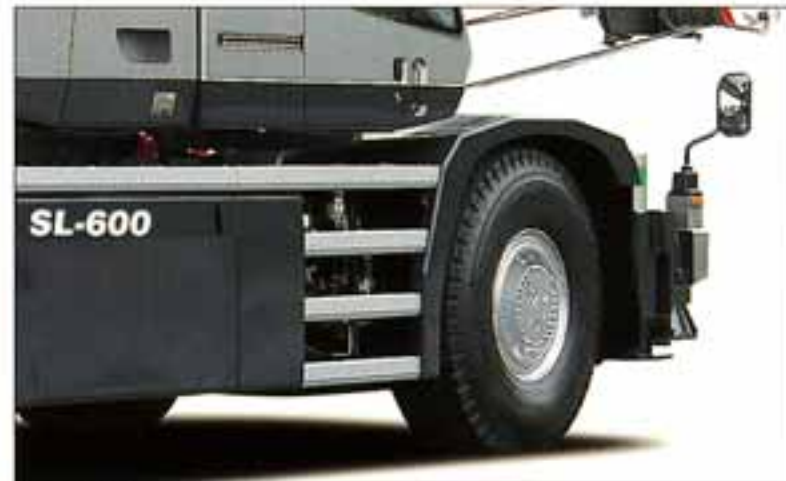
●アルミサイドステップ