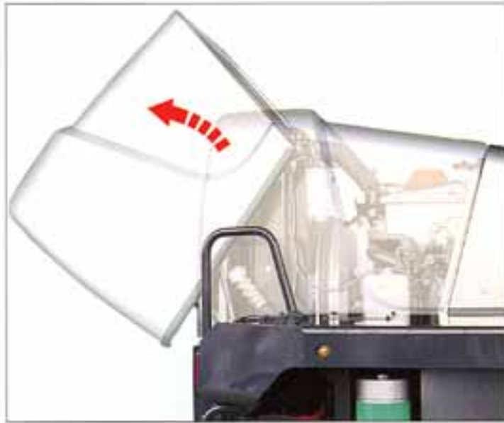
●開閉が簡単なチルト式エンジンカバー