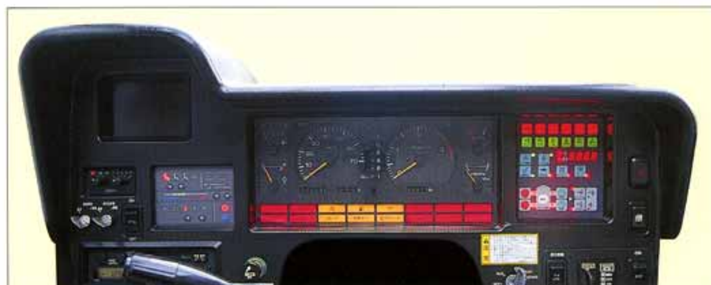
●写真は機能説明のために、各ランプを点灯したものです。実際の作業状態を示すものではありません。