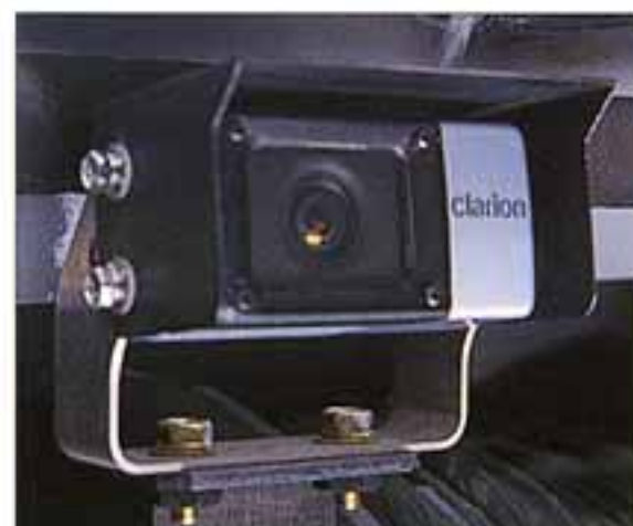
●ドラム監視カメラ(オプション)