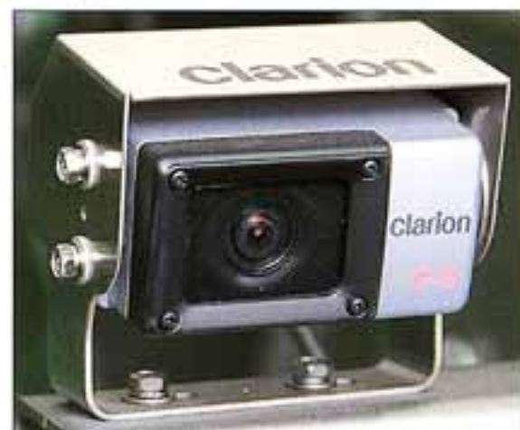
●後方確認カメラ(オプション)