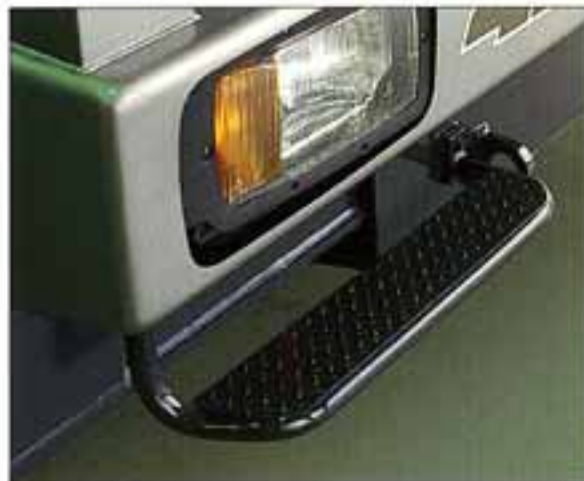
●フロントステップ

●アウトリガは、作業状況に合わせて張出幅が最大7.6m、中間6.5m・5.4m・4.3m、最縮小張出幅2.69mの5段階に、張出幅が設定できますので狭い現場でも大変有利に使えます。また、操作はキャブ内はもちろんのこと車外からも簡単に行えます。