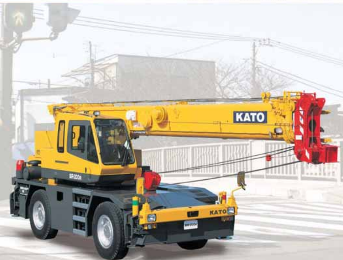
車両総重量20t未満 平成15年ディーゼル特殊自動車排ガス規制適合車

自慢のフットワーク! スムーズで軽快なコーナリング! 機敏な高性能、20t吊り!