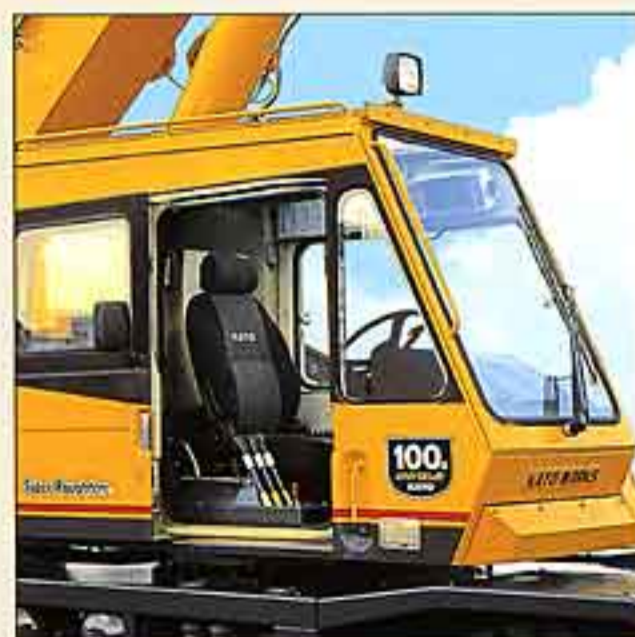
●デラックスな快適キャビン