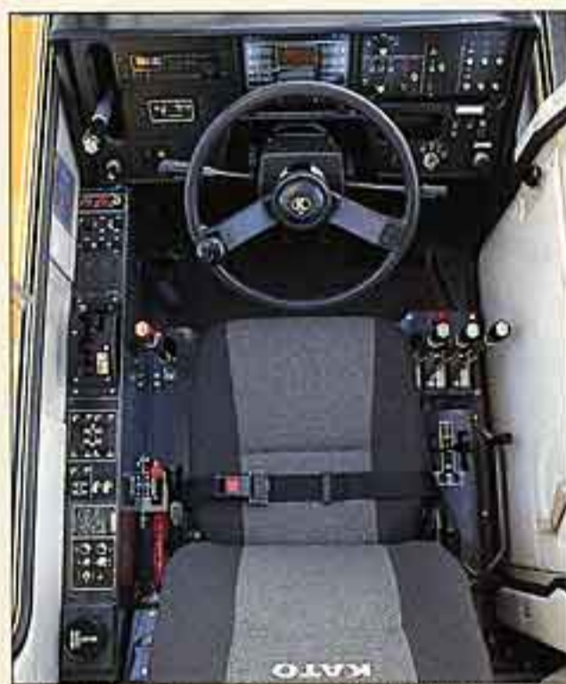
●スペシャルカラーでコーディネートされたキャビン