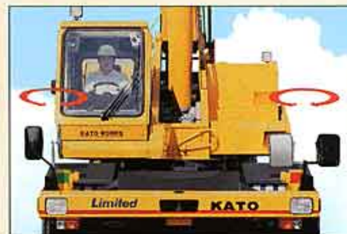
●電動格納式バックミラー