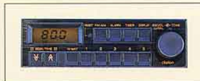
●目覚時計付AM/FM電子チューナーラジオ (FMステレオ付)