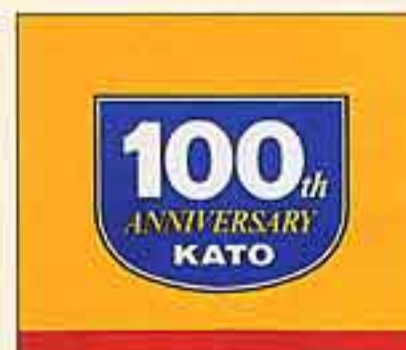
●100周年記念エンブレム