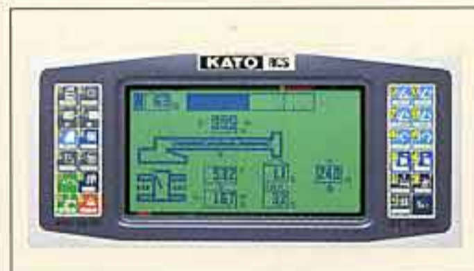
●ACSコンピューロード