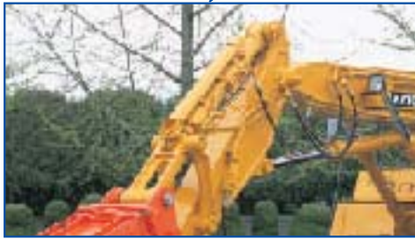
専用バケットシリンダ・損傷防止ガード