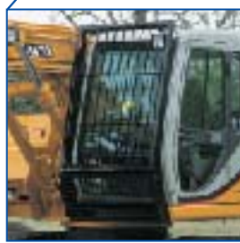
キャブプロテクタ