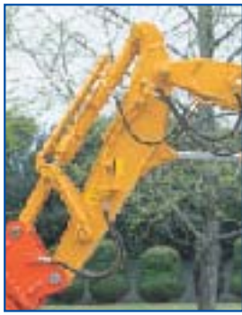
専用アーム・強化リンク