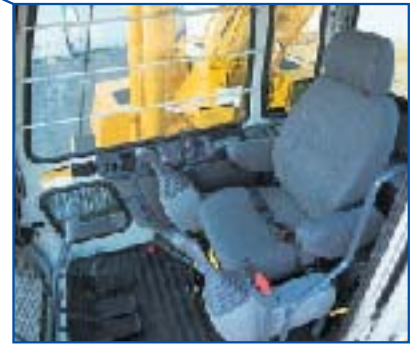
ゆったりスペースのワイドキャブ内