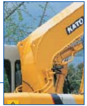
吊りフック (標準装備)