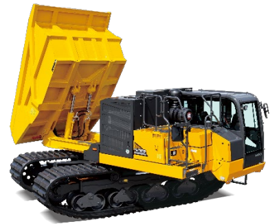
全旋回式クローラキャリア 「IC110R」