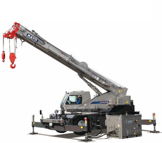
ハイブリッドラフター 「SR-250HV」